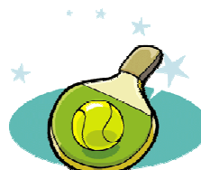
Ping-Pong / Badminton