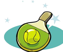
Ping-Pong / Badminton