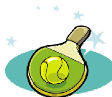
Ping-Pong / Badminton